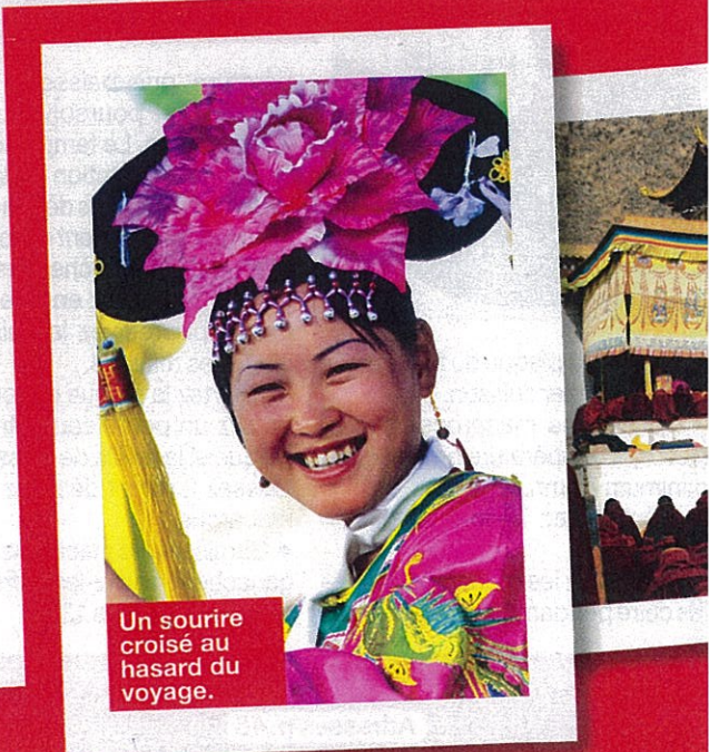
Un sourire croisé au hasard du voyage.

Quelques semaines plus tard, nous étions tous à l'aéroport de Roissy. Le voyage fut long : 24 heures de vol et d'attente pour arriver à l'ancienne capitale impériale chinoise, Xian. Il fallait bien traverser la moitié du globe ! La plupart d'entre nous en ont profité pour dormir afin