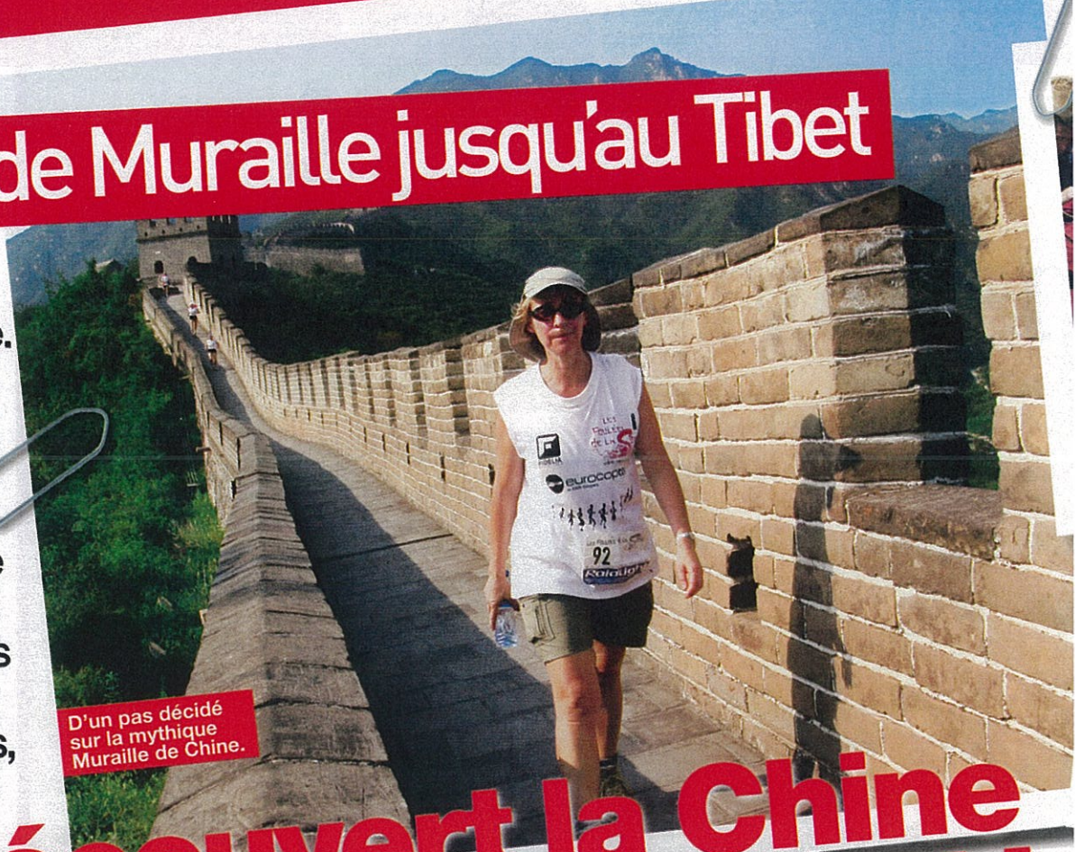
D'un pas décidé sur la mythique Muraille de Chine.