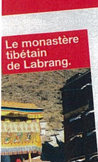
Le monastère tibétain de Labrang.