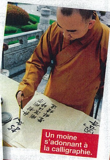
Un moine s'adonnant à la calligraphie.