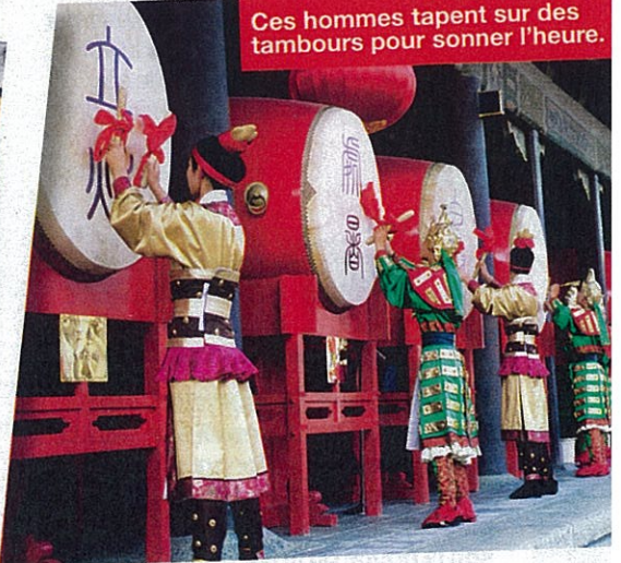
Ces hommes tapent sur des tambours pour sonner l'heure.