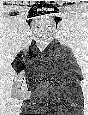
Ce petit moine tibétain est fier de porter une casquette de "L'Indépendant".

Ils retiendront aussi l'incroyable sérénité qui se dégage des lamase-raies, une réalité qui va bien